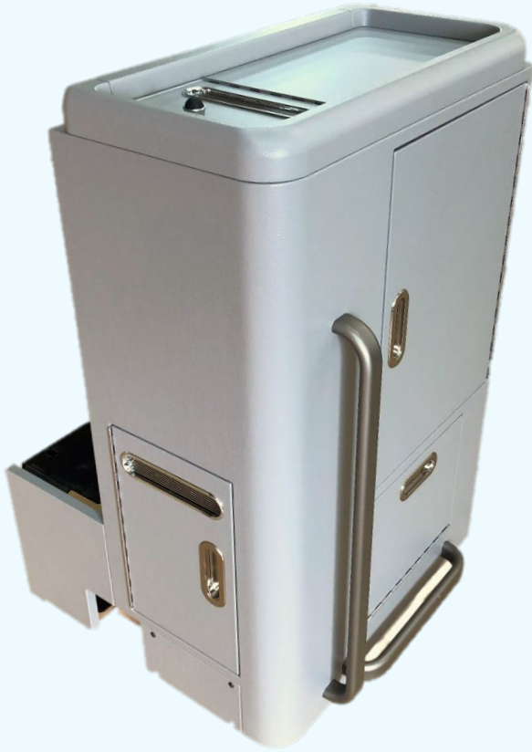
サービスボックス全体図