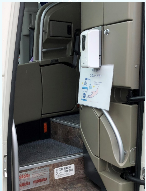
【取付車種】 三菱ふそうエアロ