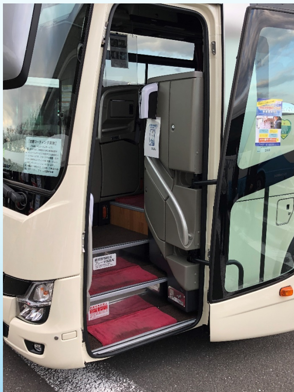
【取付車種】 三菱ふそうエアロ