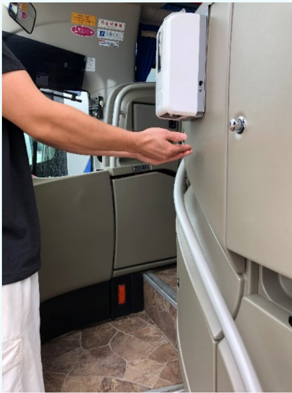
【取付車種】 三菱ふそうエアロ